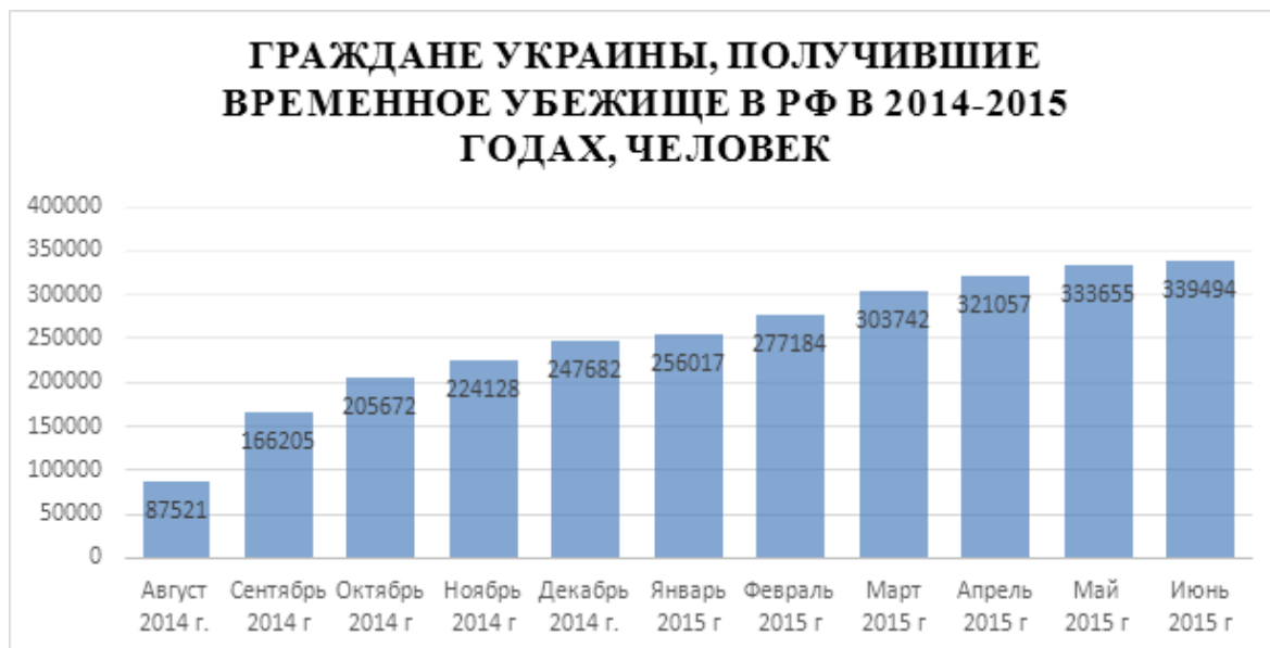
Построено на основе на официальных данных Федеральной миграционной службы Российской Федерации в 2016 году

Во-вторых, продолжалась временная трудовая миграция. Еще до начала конфликта значительно возрос поток временных трудовых мигрантов из Украины в Россию. В некоторых регионах количество приезжих рабочих увеличилось в десятки раз по сравнению с прошлогодними показателями (в Москве в 10 раз, в Ленинградской области в 30 раз!). Согласно данным Федеральной миграционной службы РФ, в 2015 году приобрели патенты около 152 тыс. украинских граждан для работы в России. Однако в связи с прогрессирующим на тот момент вооруженным конфликтом, прибывающие трудовые мигранты не спешили возвращаться обратно и находились на территории Российской Федерации больше положенного срока.