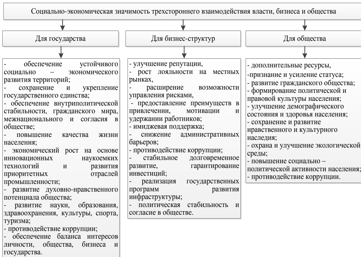
Рис. 2. Социально-экономическая значимость трехстороннего взаимодействия власти, бизнеса и общества

Изучение теоретических аспектов взаимодействия власти, бизнеса и общества позволяет сделать вывод о том, что количество классификаций моделей данного сотрудничества велико и многообразно. Тем не менее, такое взаимодействие в настоящее время используется как беспроигрышная модель с высоким потенциалом, в которой партнерские отношения между равноправными стейкхолдерами расширяют возможности решения актуальных социально-экономических проблем и вносят существенный вклад в развитие гражданского общества (см. рис. 2) [8, с. 112; 29, с. 39; 30, с. 144].