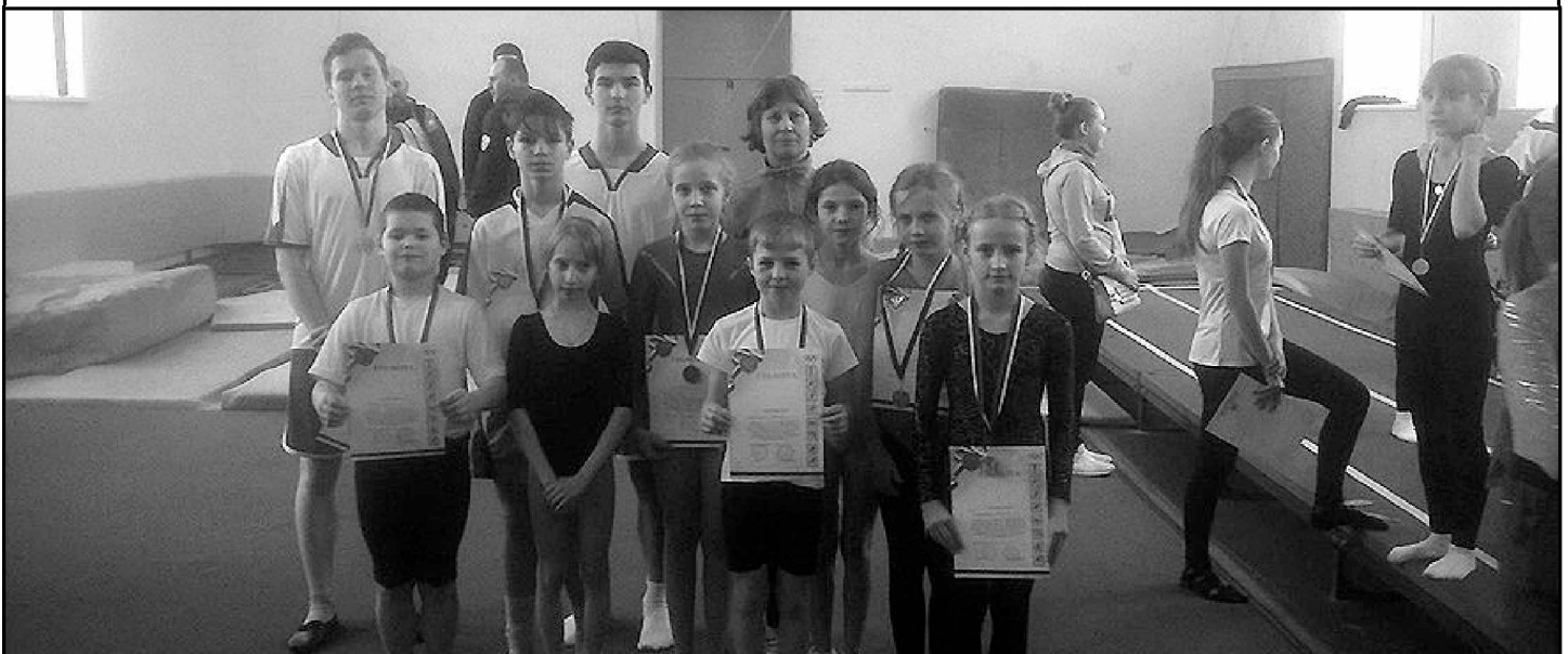
Страницу подготовил В. КОЛЯДИН.

На снимке: наши акробаты в финале Спартакиады.