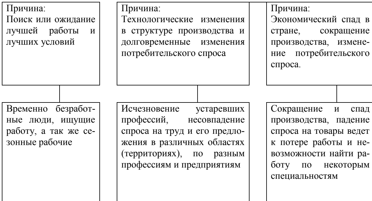
Рис. 1.1 - Виды безработицы

Примечание – Капелюшников Р. И. Общая и регистрируемая безработица: в чем причины разрыва?. - М.: ГУ ВШЭ, 2002. – С. 48.