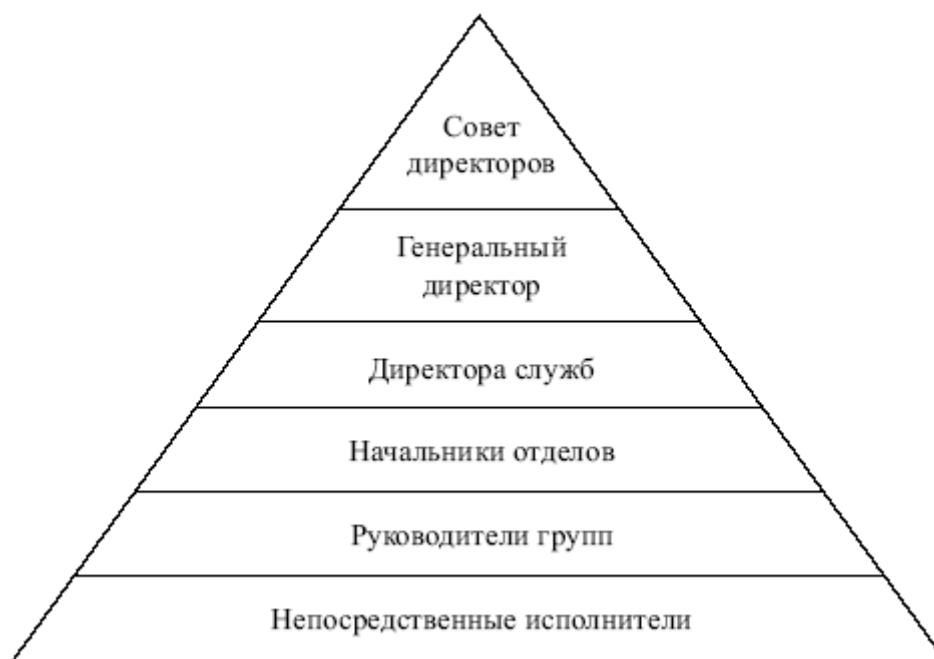
Рис.1. Уровни управления

Пирамидальная структура функционирует как единое целое на скалярной основе (предполагается, что объем полномочий и ответственности, делегированный каждому должностному лицу в линейной цепи подчиненных, уменьшается пропорционально его удалению от президента, т.е. скалярно).