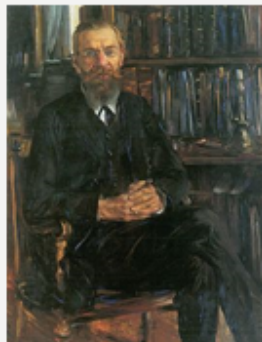
• Эдуард Мейер (1855-1930)