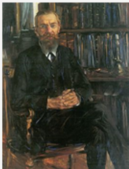
• Эдуард Мейер (1855-1930)