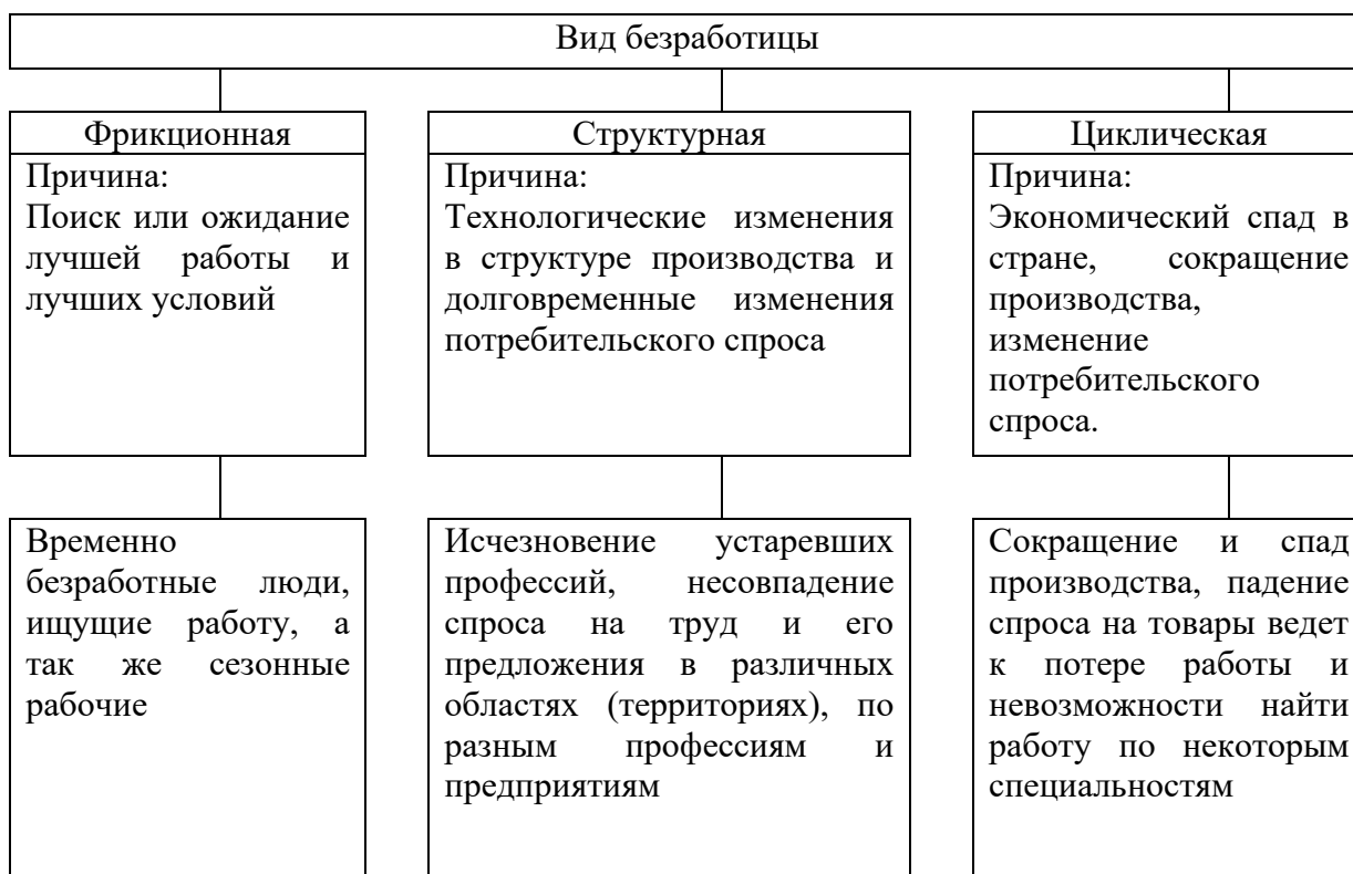
Рис. 1.1 - Виды безработицы

Примечание – Капелюшников Р. И. Общая и регистрируемая безработица: в чем причины разрыва?. - М.: ГУ ВШЭ, 2002. – С. 48.