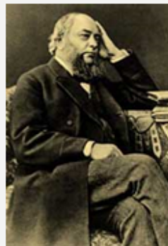
• В.П. Безобразов (1828—1889)