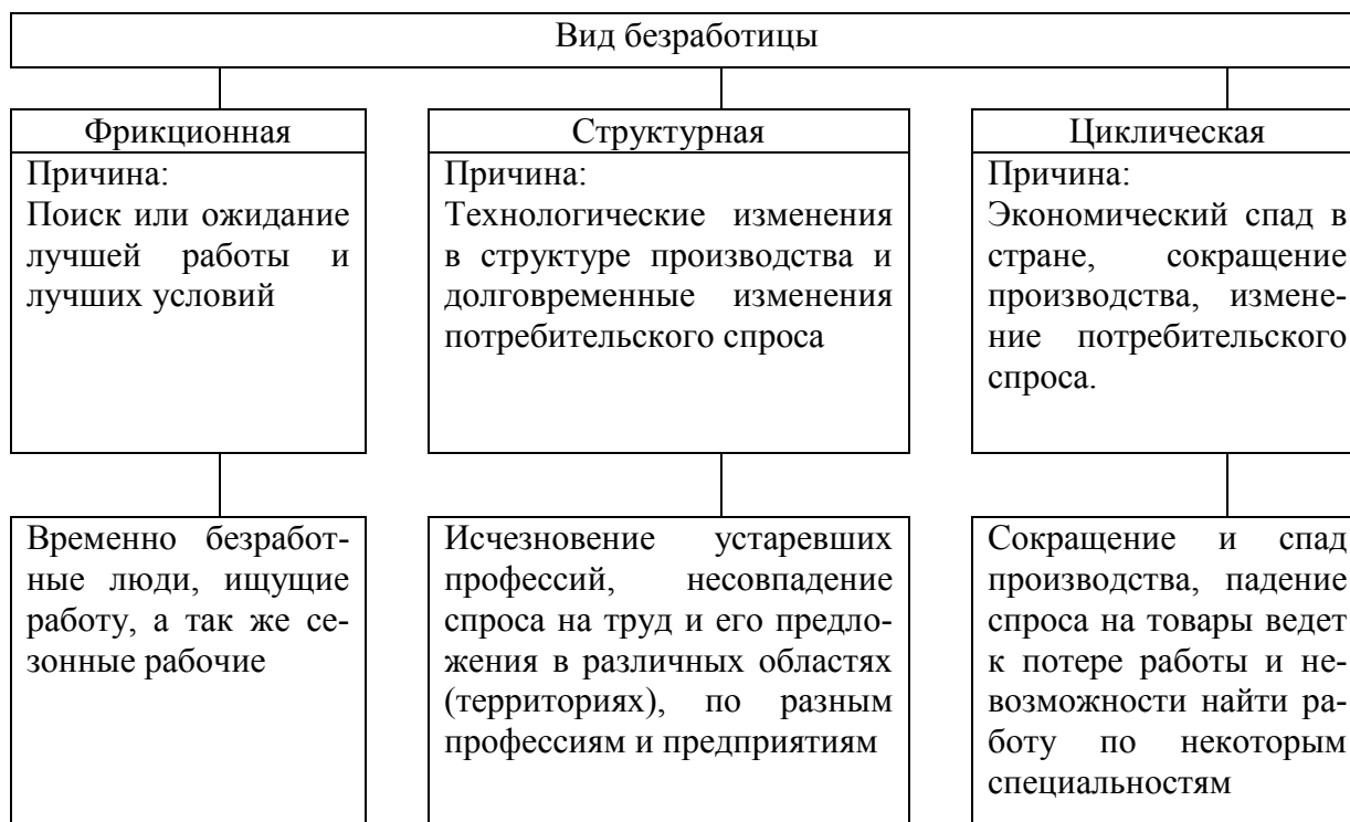
Рис. 1.1 - Виды безработицы

Примечание – Капелюшников Р. И. Общая и регистрируемая безработица: в чем причины разрыва?. - М.: ГУ ВШЭ, 2002. – С. 48.