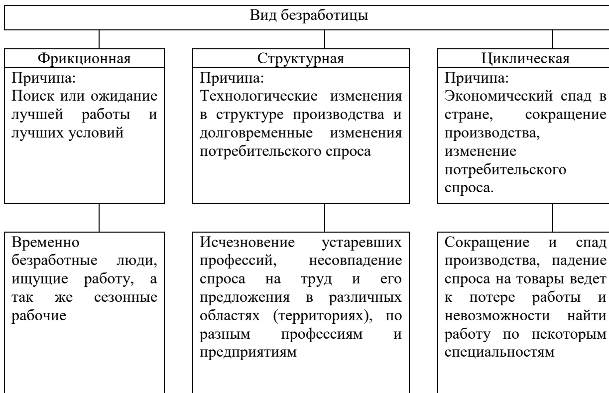
Рис. 1.1 - Виды безработицы