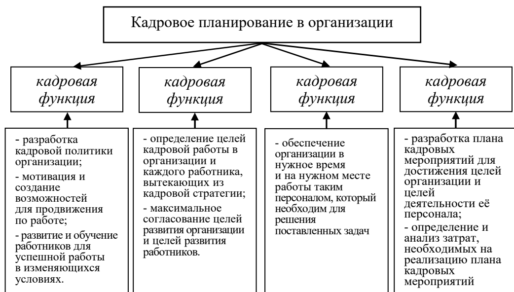
Рисунок 1. Структура основных функций кадровой деятельности