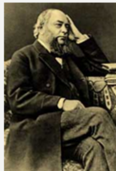
• В.П. Безобразов (1828—1889)