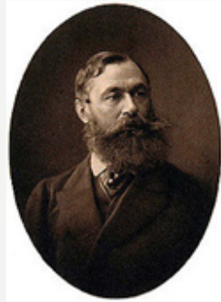
• Б.Н. Чичерин (1828-1904)