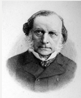
• Лоренц фон Штейн (1815—1890)