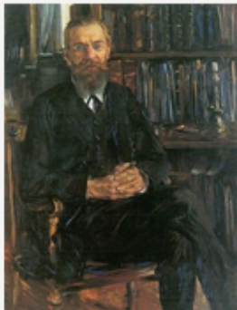
• Эдуард Мейер (1855-1930)