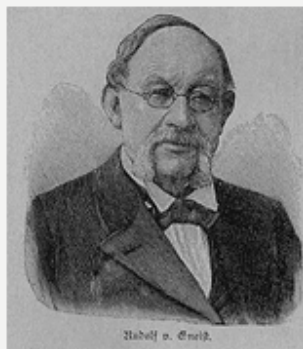
• Рудольф Гнейст (1816—1895)