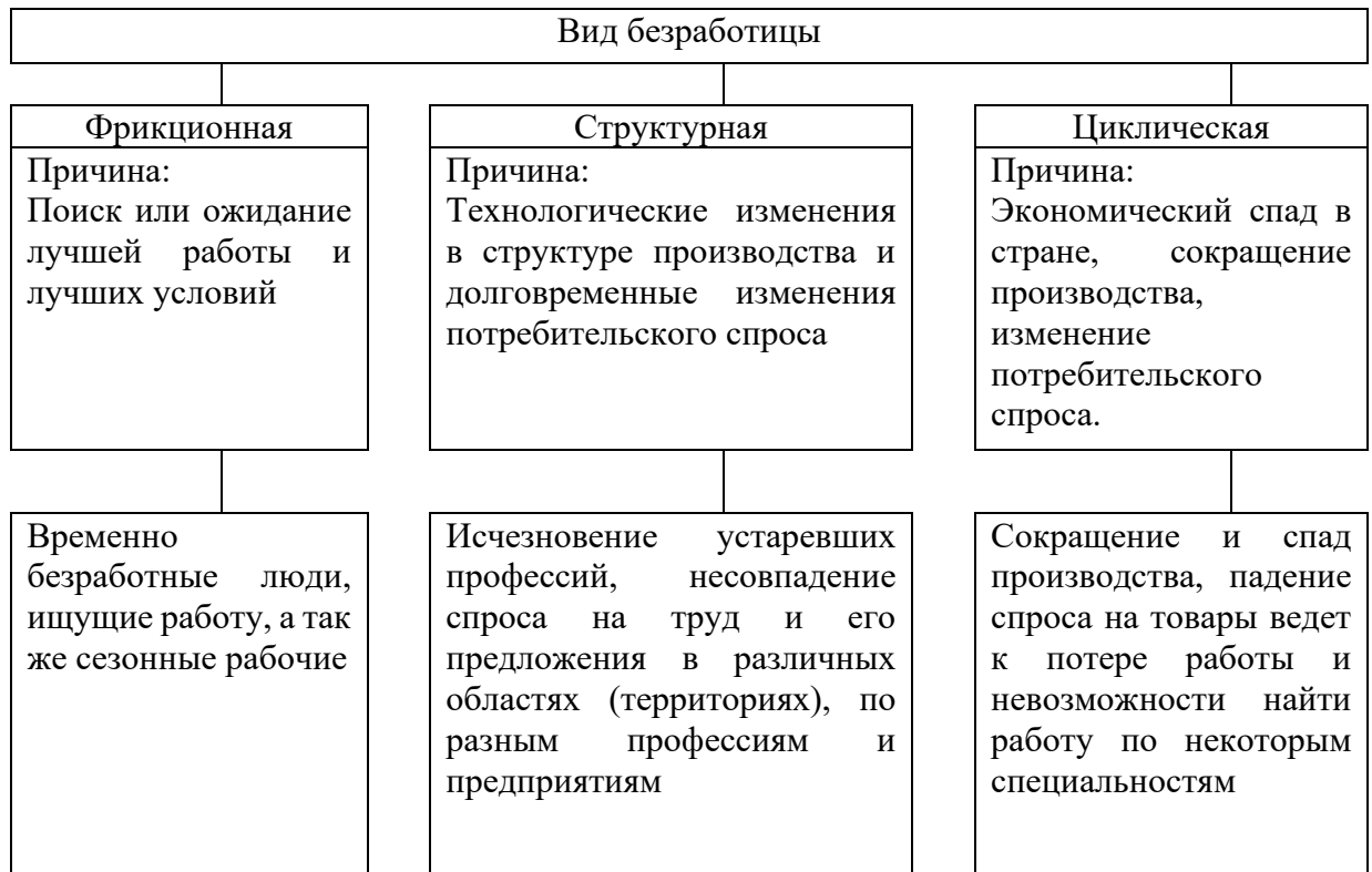
Рис. 2 - Виды безработицы

Примечание – Капелюшников Р. И. Общая и регистрируемая безработица: в чем причины разрыва?. - М.: ГУ ВШЭ, 2002. – С. 48.